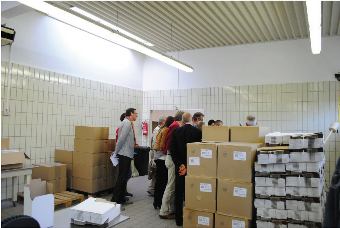
Im Fabrikationsraum. (A. Ostheimer)